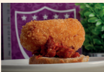
Croqueta de picadillo soriano sobre tostada

Soria Pº del Espolón, 4 975 213 935 Cierra martes Servicio tapa: de 14 a 16 h y de 21 a 23:30 h