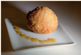
Croqueta de carrillera ibérica con manzana de Soria

Soria Pza. Ramón Benito Aceña, 8 975 214 320