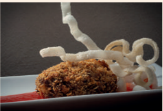
Con M de Meet

Soria Pza. Ramón y Cajal, 5 975 239 303 Servicio tapa: de 13:30 a 15:30 h y de 20:30 a 23 h