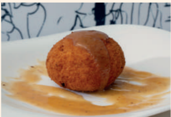
Rabo - fest