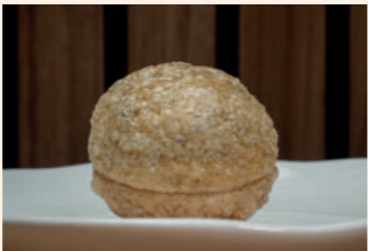
Duxelle de champiñón

Soria C/ Diputación, 1 975 245 294 Cierra domingo noche y lunes. Servicio tapa: de M a D de 13:30 a 16 h y V y S de 20:30 a 23 h