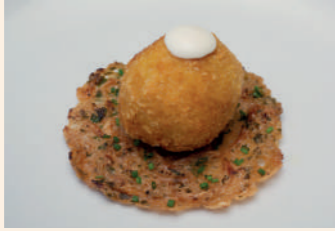
Del mar y de la montaña

Soria Parque del Castillo, s/n 975 240 800 Servicio tapa: de 13 a 15:30 h y de 20 a 23 h