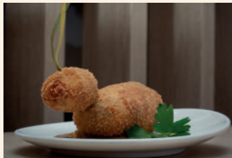
Croqueta de liebre con su jugo

Soria Ctra. de Zaragoza, Km. 146 975 213 143 Servicio tapa: de 13 a 15:30 h y de 20 a 22:30 h