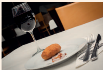
El encanto de Soria

Soria Ctra. Nacional 122, Km. 147 975 220 625 Cierra domingo tarde