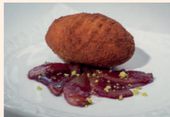
Croqueta de carrillada asada con pera confitada al vino

Soria C/ Aduana Vieja, 15 975 211 717 Cierra lunes Servicio tapa: de 13:30 a 15:30 h y de 20:30 a 23 h