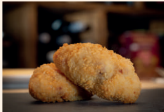
Croqueta cremosa de pulpo

Valdemaluque C/ Dehesa, 5 699 400 718 Cierra lunes y martes