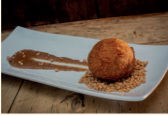
Croqueta de txuletón

Soria C/ Medinaceli, 8 975 213 845 Cierra domingo Servicio tapa: de 13:30 a 15:30 h y de 21 a 23:30 h