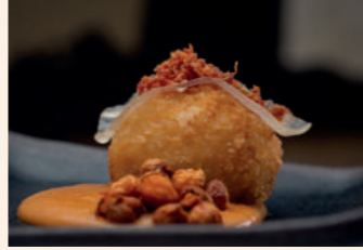
Cocido en una croqueta

Soria C/ Alfonso VIII, 10 975 226 211 Servicio tapa: de L a J de 13:30 a 15 h y de 20:30 a 22 h, V S y D de 13:30 a 15 h