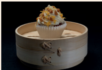
La croqueta mas coqueta

Soria Avda. Duques de Soria, 4 975 225 832 Cierra domingo Servicio tapa: de 13:30 a 15 h y 20:30 a 22:30 h