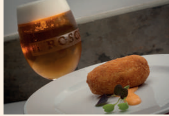
La croqueta del Moncayo